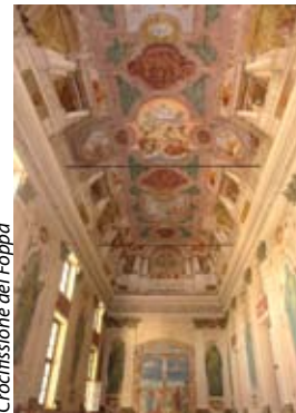
Crocifissione del Foppa

mazione contribuirono i più importanti pittori bresciani dell'epoca quale il Gambara, il Romanino, il Moretto, il Marone e il Cossali. Le leggi napoleoniche lo soppressero nel 1797, ma nel 1969 per volere del papa bresciano Paolo VI si avviò una grande opera di restauro con il ritorno degli Olivetani. La chiesa risale al 1480-90. L'interno, ad una navata, presenta una ricca decorazione settecentesca. Ospita un'importante tela del Moretto del 1545 e bellissimi lavori di intarsio ligneo negli stalli del coro, opera del 1480 di Cristoforo Rocchi.