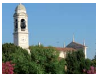
Parrocchiale di S. Zenone

castello Ricetto . Costruito intorno al X secolo per proteggere la popolazione dalle invasioni degli Ungari, fu ricostruito tra il XIII ed il XIV secolo. I muri in ciottoli sono sormontati da una merlatura ghibellina aggiunta probabilmente solo agli inizi dell'Ottocento. Notevole sul lato orientale è l'imponente mastio quadrato e, sulla parte sud, rimangono le torri angolari semicirculari. Al cortile interno si accede da un portale del XVIII secolo. Sorgono qui alcune costruzioni rurali. Frontalmente al castello si erge la cinquecentesca villa Fassati , con facciata settecentesca e