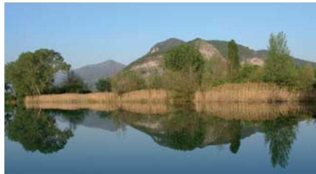
torbiere del Sebino

E' la vegetazione col suo aspetto e la sua variegata composizione a caratterizzare i lineamenti più visibili del paesaggio del Lago d'Isèo e della Franciacorta. I boschi di latifoglie, le praterie, i pascoli ed i prati,