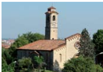
Chiesa di S. Stefano

torno all'VIII secolo e ampliata in periodi successivi, la chiesa presenta caratteristiche degli stili paleocristiano e romanico con influssi gotici. Nell'abside conserva affreschi quattrocenteschi, alcuni dei quali attribuiti al Foppa . Proseguendo lungo il sentiero del Monte Orfano si giunge al Convento dell'Annunciata , luogo dello spirito immerso nella natura (vedasi pag. accanto). Un'ulteriore sosta deve essere dedicata alla chiesa di San Michele , risalente al X sec.