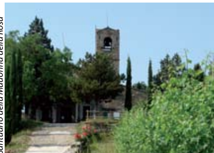
Santuario della Madonna della Rosa

Il nome di questo comune ci suggerisce l'ondulato territorio sul quale si sviluppa, fatto di dolci colline che ospitano antiche località medievali e quartieri più recenti con belle ville. Nonostante lo sviluppo industriale, Monticelli conserva una chiara impronta agricola, soprattutto nel settore vinicolo, come dimostrano le numerose cantine distribuite nelle varie frazioni e i terrazzamenti coltivati a vite che connotano piacevolmente il