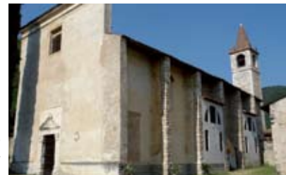
Pieve di S. Maria

offre un'ospitalità e una cordialità festosa che ha origini antiche. Molte le strutture religiose che contraddistinguono il patrimonio artistico di Gussago. Tra le più belle vi è sicuramente la pieve di Santa Maria che venne realizzata nel 1470 sulle rovine di un precedente edificio longobardo. L'interno è a navata unica con abside poligonale, impostata su una seconda semicircolare del IX-X secolo. Sono conservati affreschi quattrocenteschi della scuola del Foppa e dei due Paolo da Caylina (Vecchio e Giovane). La