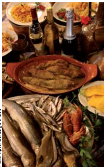
Platti tipici del Lago d'Isèo

Dopo il pasto è la volta di raffinati vini da dessert ed acquaviti, giovani e invecchiate.