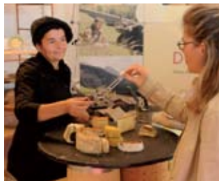
Franciacorta in bianco