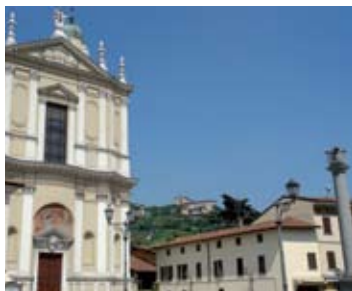
Parrocchiale di S. Maria Nascente