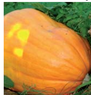
Sale in Zucca

Saiano. Spostandosi verso il lago, si annovera la " Settimana della Tinca " che si tiene nel mese di luglio a Clusane, specialità del paese dalla metà dell'ottocento. Altra manifestazione conosciuta a livello nazionale è " Sale in Zucca " a Sale Marasino, che decreta a settembre il Re della zucca, ossia colui che ha coltivato la zucca più grande d'Italia e permette di degustare piatti a base di zucca nei ristoranti del comune. Numerosi sono gli eventi gastronomici con menu a base di carne: ad aprile il " Mese del Manzo all'olio " a Rovato e la " Settimana del Brasato " a Capriolo, a settembre la " Sagra dello Spiedo " a Gussago,