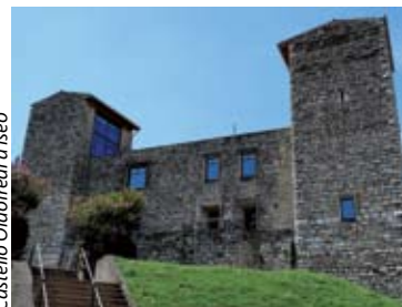
Castello Oldofredi a Isèo

Un impulso all'edificazione di strutture difensive venne anche dalle contese fra Bergamo e Brescia per il controllo del fiume Oglio. Un'altra tipologia d'insediamento presente nell'area è quella dei borghi rurali, con le loro caratteristiche architetture rustiche, spesso d'origine