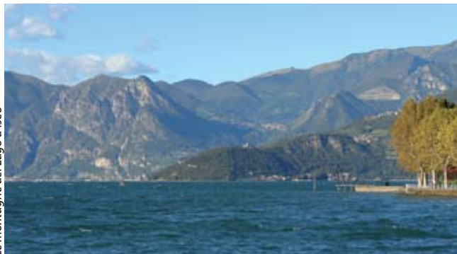
Le montagne del Lago d'Isèo

L'impronta glaciale ha lasciato i segni più spettacolari, qui i ghiacciai camuni hanno abbandonato grandi quantità di detriti che costitui-