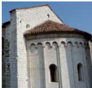
Pieve di S. Maria a Erbusco

vour . Ai piedi del Monte Orfano da visitare la chiesa di Santo Stefano , e, sulla cima, il convento dell'Annunciata (pag. 33). Da Rovato merita una breve deviazione la visita al Castrum romano di Coccaglio (pag.14), per ritornare poi sui nostri passi in direzione di Erbusco (pag.16). Dalla strada provinciale si vede la scenografica villa Lechi , mentre entrando in paese incontriamo sulla sinistra il palazzo Cavalleri , sede