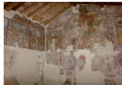
Affreschi della Disciplina

cappella a sinistra del portale (1555). Da sotto l'impianto dell'organo si accede ad un bel chiostro e da esso alla Disciplina di Santa Maria Maddalena (XVI sec.), così chiamato perché era il luogo dove si riuniva la confraternita dei Disciplini, movimento che praticava rigide pratiche di mortificazione del corpo per espriare i peccati. Il ciclo di affreschi conservato narra la storia di Gesù dalla nascita fino all'Assunzione ed è databile agli inizi del XVI secolo ma l'autore è sconosciuto. Meritevole d'attenzione è anche la cappella barocca nello spazio antistante la chiesa. Gli affreschi sono datati al XV e XVI sec.; non concordanti i giudizi sull'attribuzione. Informazioni: 10.00-12.00 e 14.00-17.00 lunedì chiuso; per gruppi contattare il numero 030/983477