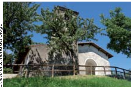
Chiesa di S. Maria del Giogo

Al confine con Pilzone di Iseo, un pittoresco golfo formato dalla bella penisola del Montecolo, ospita l' Associazione Nautica Sebina che fa di Sulzano il punto di riferimento per gli amanti della vela, che qui trovano ogni attrezzatura per praticare al meglio questo sport. Caratteristico borgo a lago con vicoli nascosti e abitazioni molto vicine le une alle altre, Sulzano è oggi il porto più agevole per raggiungere Montisola, grazie alle