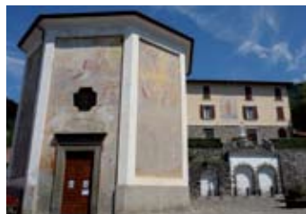
Cappella dell'ex cimitero