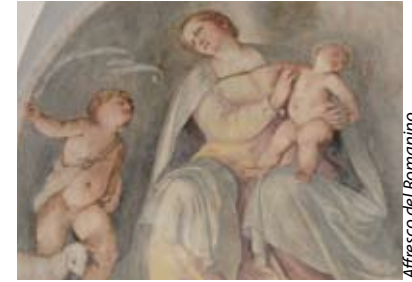
Affresco del Romanino

mazione contribuirono i più importanti pittori bresciani dell'epoca quale il Gambara, il Romanino, il Moretto, il Marone e il Cossali. Le leggi napoleoniche lo soppressero nel 1797, ma nel 1969 per volere del papa bresciano Paolo VI si avviò una grande opera di restauro con il ritorno degli Olivetani. La chiesa risale al 1480-90. L'interno, ad una navata, presenta una ricca decorazione settecentesca. Ospita un'importante tela del Moretto del 1545 e bellissimi lavori di intarsio ligneo negli stalli del coro, opera del 1480 di Cristoforo Rocchi.