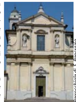
Parrocchiale di S. Pancrazio

All'interno delle mura si trova la chiesa della Madonna del Castello (XVII sec.) che ospita un'immagine venerata anticamente dagli abitanti per "i bisogni della pioggia" in epoche di siccità. La chiesa parrocchiale , dedicata a San Pancrazio