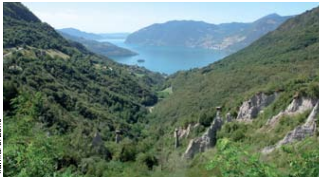
Piramidi di Zone

da rocce chiare simili tra loro, il più delle volte stratificate, di origine marina.