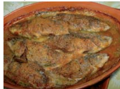
Tinca al forno

novità tecnologiche e rivisitazioni moderne, con un risultato di grande qualità.