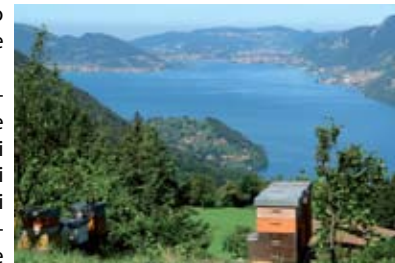
Apicoltura sul Lago d'Isèo

Le numerose aziende agricole allevano anche altre specie animali, come gli equini, i suini, gli animali da cortile, associandovi spesso l'apicoltura, la coltivazione di piccoli frutti e