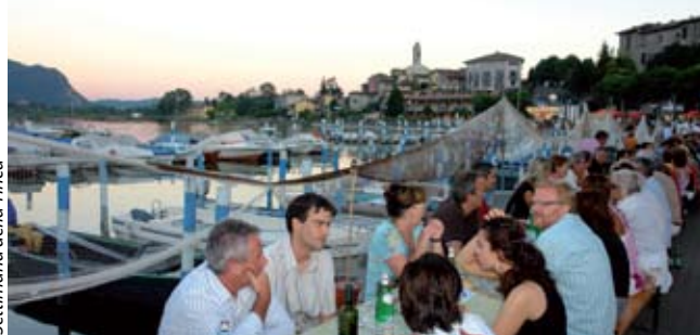
Settimana della Tinca

lago. La storia trova fedele rappresentazione in diverse rievocazioni, tra le quali spicca "Rivive l'Antica Valeriana" in maggio a Sale Marasino, con centinaia di figuranti in costume. La tradizione commerciale si concretizza in una cospicua presenza di mercati, fiere e rassegne che si susseguono durante tutto il corso dell'anno. Una delle più prestigiose è senz'altro "Lombardia Carne" , ultracentenaria vetrina della migliore produzione bovina dell'Italia settentrionale.