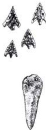
Torbiere del Sebino; punte di freccia e lame

Il territorio del Lago d'Isèo e la cerchia di colline moreniche che prende il nome di Franciacorta, oltre ad essere caratterizzati da un'unica origine geologica e naturalistica, hanno vissuto comuni vicende storiche e culturali che li hanno resi ricchi di testimonianze.