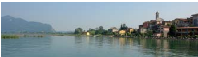
Clusane sul Lago

vestro del XIII secolo; nell'abside è affrescata una " danza macabra ". In posizione elevata rispetto al centro, domina l'abitato il Castello Oldofredi (XIII secolo), attuale sede della biblioteca comunale. Il comune comprende tre frazioni: Pilzone , Cremignane e Clusane . Dominato dal castello del Carmagnola (1429), Clusane è un borgo di pescatori, rinomato anche presso gli esperti per la sua tradizione gastronomica.