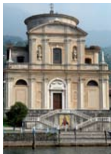
Parrocchiale di S. Zenone

Nel centro storico di Marasino si trova la quattrocentesca chiesa di San Antonio Abate con affreschi di notevole valore artistico. Sulla strada principale si trova la chiesa di San Pietro dei Disciplini (XVI sec.) al cui interno vi sono affreschi del primo Cinquecento. A Gandizzano merita una visita la chiesa di Santa Maria della Neve (XVI sec.). A Maspiano vi è la cinquecentesca chiesa di San Giacomo Apostolo . A Conche , infine, la bella chiesa di San Giovanni Battista costruita nel 1700.