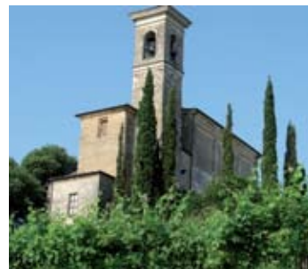
Chiesa di S. Zenone

panoramica, introdotto da un piccolo vigneto, il santuario della Madonna della Rosa , la cui torre massiccia fa pensare ad un posto di guardia eretto in epoca remota. Costruito nel XV secolo ed in seguito rimaneggiato conserva al suo interno opere del Cossali e del Paglia . Racconta una leggenda che in questo luogo la Madonna soccorre un assetato indicandogli una sorgente, mentre ai suoi piedi sbocciava un roseto.