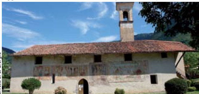
Chiesa di S. Giorgio

frazione di Cislano , di enormi guglie di terra che sostengono grossi massi: le piramidi di terra o erosione , risultato di un raro fenomeno naturale che vanta pochi esempi al mondo. In questo luogo straordinario, merita un attento sguardo la chiesetta di San Giorgio , parrocchiale di Zone fino al XVI secolo. Fu costruita nel XV secolo, sulla parete laterale esterna ci sono degli affreschi del 1400 tra cui San Giorgio a cavallo mentre uccide il drago . Proseguendo in