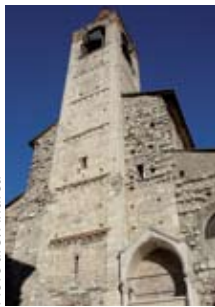
Pieve di S. Andrea

del lago. Il centro storico di origine medievale trova il suo fulcro nella piazza Garibaldi circondata da antichi edifici con portici che ricordano il fervore operoso di un tempo. Qui si trovano il primo monumento eretto in Italia (1883) in onore dell'eroe dei due mondi, il municipio