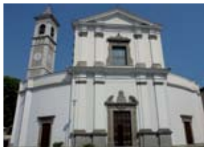
S. Giorgio a Capriolo

che racchiude al suo interno un singolare museo di raffinati paramenti sacri. Un viottolo in salita conduce alla chiesa di Santa Maria Assunta , antica parrocchiale ora chiesa del cimitero, mentre a circa un chilometro merita una visita la chiesa di Santa Maria in Favento ; infine, decentrato, il Santuario della Madonna della Neve . Riprendiamo la strada principale per raggiungere Capriolo (pag.12). Degne di nota la parrocchiale di S. Giorgio , che conserva una tela del Romanino, e la chiesetta di S. Onofrio , collocata sulla collina a nord dell'abitato. Spostandoci verso sud-ovest lungo il corso del fiume Oglio, raggiungiamo Palazzolo (pag. 24), l'ultima tappa dell'itinerario. Il centro storico, è caratterizzato dalla parrocchiale di Santa Maria Assunta , dall'antico borgo di Mura e dall'imponente Torre del Popolo .