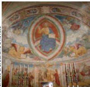
Chiesa di S. Stefano a Rovato