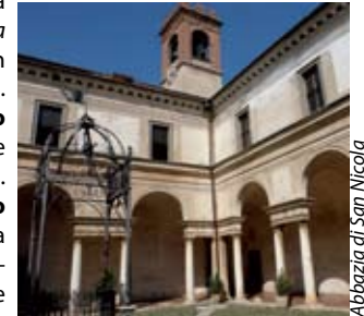
Abbazia di San Nicola

In frazione Cerezata una stradina porta al santuario della Madonna dell'Avello , visitabile a settembre in occasione della festa della Natività. Da Ome proseguiamo per Rodengo Saiano (pag. 30), con destinazione l' abbazia di San Nicola (pag. 31). Si riparte in direzione di Gussago (pag.17), al quale si accede dalla località Ronco. Di particolare interesse i diversi edifici nobiliari e religiosi, fra i quali spiccano la pieve di Santa Maria e la Santissima , posta alla cima del colle Barbisone. Più a sud si raggiunge Castegnato (pag. 13), dove ci accoglie in centro la parrocchiale di San Giovanni Battista . Meritano, inoltre, una sosta le dimore storiche presenti in paese e nelle immediate vicinanze. Si procede, quindi, per Paderno Franciacorta (pag.23), dove in piazza si erge il castello medievale , completamente rinnovato. Una piacevole strada immersa nella verde campagna conduce a Passirano (pag.25) dove, all'uscita del paese in direzione di Cazzago San Martino, si trova solitario e maestoso il castello ricetto . Proseguendo in località Montorondo, si incontra Corte Franca (pag.15). Ad accogliere Borgonato, con i palazzi Lana-Berlucchi e, a fianco, la parrocchiale. Da qui ci spostiamo sulla provinciale Iseo-Rovato che permette di raggiungere Ni-