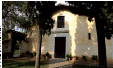
Chiesa di S. Michele

costruzione di una struttura ospedaliera e di un centro termale. Su un colle della contrada Cerezata si trova il santuario della Madonna dell'Avello . La chiesa attuale è del '400 e presenta affreschi votivi del '500 e '600. Sempre in collina, ma in contrada Goiane, sorge la chiesa di San Michele . La struttura attuale è quattrocentesca