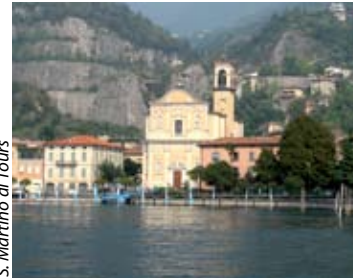
S. Martino di Tours

per la coltivazione dell'ulivo, che gli ha conferito il nome di " città dell'olio ". Marone è anche il luogo ideale per le passeggiate, a piedi e in mountain-bike lungo i numerosi sentieri che dal centro salgono verso la Croce di Marone e il Monte Guglielmo.