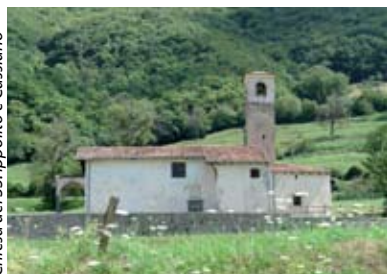
Chiesa dei SS. Ippolito e Cassiano

affreschi e le statue lignee dei Santi Ippolito e Cassiano. Il portale è in pietra di Sarnico. Il centro storico, con antiche case di legno e di pietra, alcune delle quali risalgono al XVII secolo, ospita la parrocchiale di S. Giovanni Battista (XVII sec.). L'ingresso laterale è preceduto da un pronao con volta a crociera. L'interno, a navata unica, è ricco di opere lignee scolpite dal Fantoni . Sulla stessa piazza si trova la settecentesca capPELLA dell'ex cimitero a pianta ottagonale.