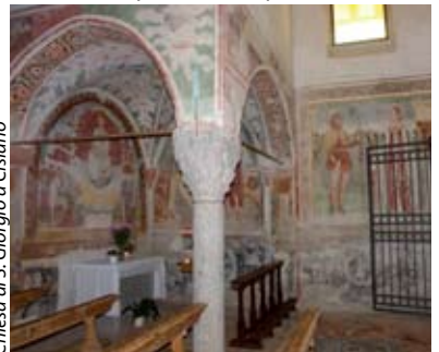
Chiesa di S. Giorgio a Cislano