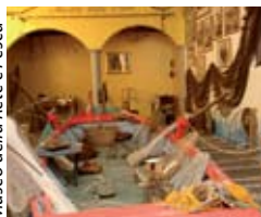
Museo della Rete e Pesca

sui resti di un edificio sacro pagano: la vista è spettacolare. Il capoluogo, Siviano , conserva tracce medievali nelle murature in pietra, negli