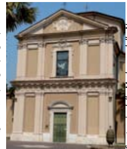
Santuario della Madonna della Neve