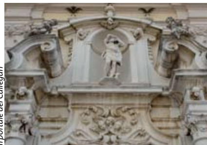
Il portale del Callegari

Il nome del comune, collocato a ridosso della città di Brescia, deriva da un bosco di castagni posto anticamente a sud dell'abitato. Data la natura pianeggiante del suolo, l'abbondanza di acqua e la discreta fertilità del terreno, il paesaggio fu prevalentemente trasformato ad uso agricolo, in particolare per la coltivazione del grano; oggi all'agricoltura si affiancano