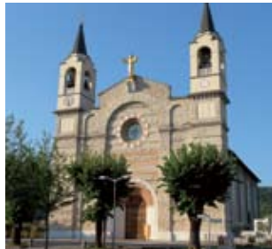
Parrocchia Cristo Re Saiano

vuto anche alle diverse origini (Saiano risale all'epoca romana, mentre Rodengo è di origine longobarda), uniti in unico comune solo nel 1927. Il comune odierno, costituito anche dalla località di Padergnone , basa la propria economia oltre che sulla storica attività agricola, su un buon tessuto artigianale e commerciale. Negli ultimi anni, grazie alla presenza di importanti centri religiosi, la cittadina è meta di numerosi turisti. Complesso religioso più conosciuto ed importante della Franciacorta, l' abbazia di San Nicola (vedasi pag. accanto) è il simbolo di Rodengo Saiano. La sua fondazione risale al 1090 per opera dei Benedettini Cluniacensi e, infatti, fa parte dell'itinerario cluniacense europeo. Tra le dimore nobiliari spicca in località Corneto la bellissima villa Fenaroli con portico e ampio giardino. La villa, dal tipico stile architettonico bresciano con il corpo centrale alto rispetto alle due ali laterali più basse, si intravede da un'elegante cancellata. Sul monte Delma sorgono la chiesa di Santa Maria degli Angeli ed il convento francescano, entrambi del '500. I due edifici religiosi sono raggiungibili da un percorso con Via Crucis che ha dato il nome di Calvario alla collina circostante.