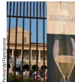
Festival del Franciacorta

di assaggio e laboratori del gusto, ambientato in splendide dimore. Data l'importanza che sta assumendo la produzione di olio d'oliva a livello economico e turistico, il territorio propone due diversi eventi che celebrano questo nobile prodotto: " Dall'olivo ... all'olio " a Marone all'inizio di giugno e " Sapor d'olio " a fine novembre a Rodengo