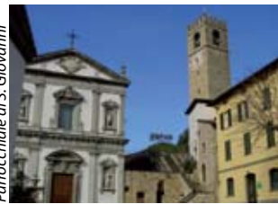
Parrocchiale di S. Giovanni

Santa Maria Assunta , primitiva parrocchiale posta in collina nell'antico castello, riccamente affrescata nel cinquecento dal Ferramola . Al centro dell'abitato sorge la nuova parrocchiale di San Giovanni Battista (XVII-XVIII sec.), ricca di fregi e decorazioni barocche, con opere dei Fantoni da Rovetta . Al suo interno, di recente realizzazione, il Museo della Parrocchiale con paramenti sacri finemente ricamati. A circa un chilometro dal centro, si trova la chiesa di Santa Maria in Favento , innalzata nel Duecento e affrescata nel Quattrocento e Cinquecento. Presieduto dai frati Carmelitani Scalzi è il santuario della Madonna della Neve (XVIII sec.), sorto nel luogo di una chiesetta che ricordava l'apparizione della vergine ad un giovane pastore sordomuto nel 1519. Presso il santuario si trova il museo della Seta e del Lino a testimonianza del ruolo che queste attività ebbero nell'economia del luogo. Tra gli edifici civili da ricordare il secentesco palazzo Bargnani-Dandolo , oggi sede del municipio, che custodisce un celebre ritratto opera del Pitocchetto . A fianco del palazzo, sorge la coeva cappella gentilizia, a forma ellittica. A Torbiato , nella settecentesca parrocchiale, dedicata ai santi Faustino e Giovita , una pala di Antonio Paglia .