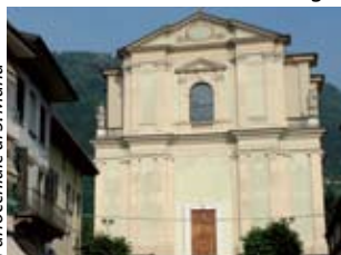
Parrocchiale di S. Maria