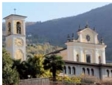
Chiesa di San Giorgio

mountain-bike o in macchina percorrendo strada per Nistino, ad un'altezza di circa 1000 metri si trova la quattrocentesca chiesa di Santa Maria del Giogo al cui interno vi sono numerosi affreschi del '400 e del '500. Mozzafiato la vista sul lago. Si trova, invece, nel borgo a lago la piccola chiesa della Visitazione ; in stile barocco presenta una facciata semplice con un bel portale del '700. All'interno, si trovano un altare ligneo e affreschi di autore ignoto. Sulla strada costiera, ville signorili si affacciano a lago.