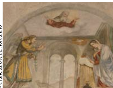
Annunciazione del Romanino

Sulla cima del Monte Orfano, riconoscibile da lontano per il doppio loggiato dal quale si gode una vista spettacolare sulla pianura sotto-