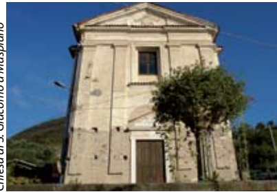
Chiesa di S. Giacomo a Maspiano

alla piazza del Mercato, dove si innalza la Torre del Vescovo , e alla vicina piazza Corna Pellegrini dove si trova la parrocchiale di Santa Maria Assunta . Al limite nord del paese, chiudono il nostro viaggio due gioielli della storia e dell'arte lacustre: le chiese di S. Maria in Silvis e di S. Maria della Neve .