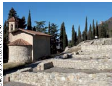
Chiesa di S. Rocco e il castello