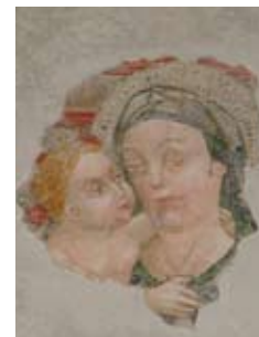
Affresco "Madonna della tenerezza"

stante, si trova il convento dell'Annunciata. Armoniosamente immerso nella quiete della natura, nel luogo di un'antica cappella dedicata all'Annunciata, l'edificio fu edificato dalla congregazione dei Servi di Maria tra il 1449 e il 1503, anno in cui furono completati la chiesa e il chiostro, pregevole per i bassorilievi dei capitelli.