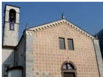
S. Maria in Silvis

data da caratteristici portici che ospita la monumentale Torre del Vescovo edificata nel 1250; essa misura 32,60 metri di altezza, con una base quadrata di circa 7 metri di lato. La leggenda racconta che qui vennero arse vive nel 1518 otto donne accusate di stregoneria. La chiesa parrocchiale , edificata a partire dal 1769 è dedicata a S. Maria Assunta ; l'interno è a navata unica con sei cappelle laterali e decori ottocenteschi. Ma il tesoro artistico di Pisogne è rappresentato dalla Chiesa di Santa Maria della Neve (vedasi pag. accanto).