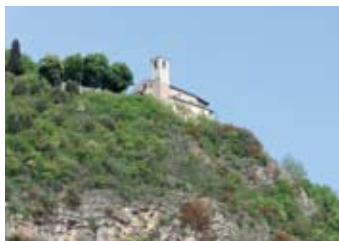
Madonna del Corno