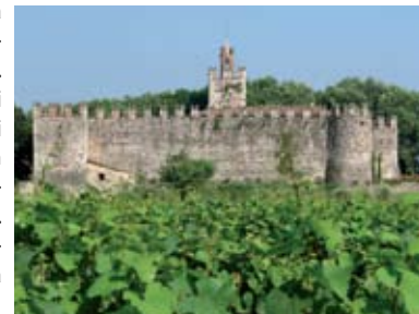
Castello di Passirano

diffusa devozione popolare, soprattutto mariana. In genere questi luoghi di culto sono esterni ai centri abitati, spesso addirittura in luoghi isolati e raggiungibili solo tramite mulattiere. Un'altra presenza significativa nel territorio è quella dei monasteri.