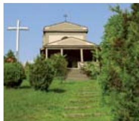
Chiesa di S. Onofrio

La ricchezza del passato è testimoniata dalla presenza di palazzi e nobili abitazioni.