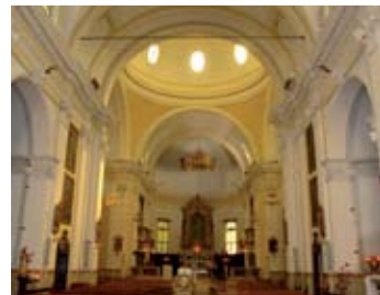
Parrocchiale di S. Giovanni

che viene festeggiato con grande solennità ogni 25 anni e del quale si conservano le spoglie nella parrocchiale. Al suo interno vi sono dodici tele settecentesche del Paglia dedicate agli Apostoli e ricche decorazioni in marmo e stucco. La santella della Madonna del Buon Viaggio , con dipinto attribuito a Dino Decca , sorge nei pressi del torrense Gandovero. Tra le dimore più rilevanti del paese si menzionano